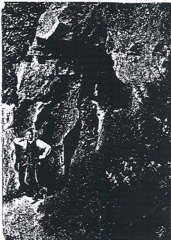
Valkenburg L., — Grotbewoner.